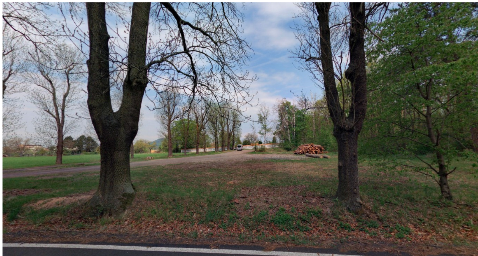
pohled z jihu – z komunikace II.třídy na H. Beřkovice