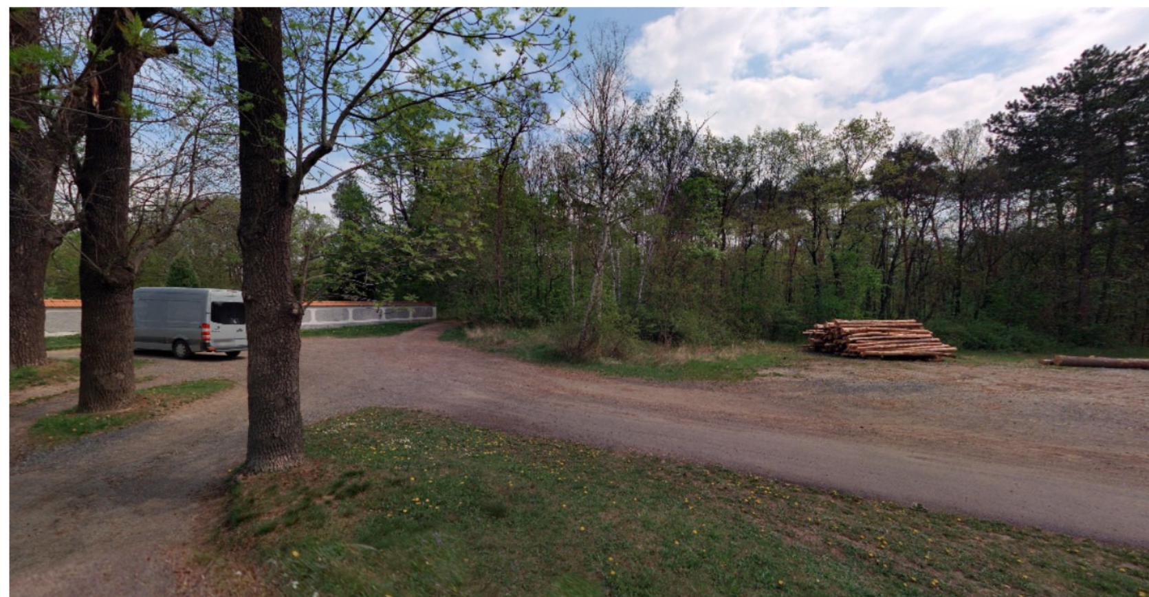
napojení na stávající lesní cestu