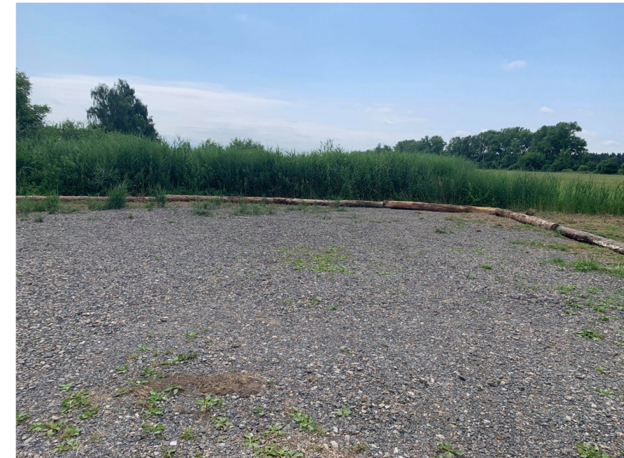
Štěrkový povrch u parkovacích stání, ta lze případně oddělit – zvýraznit pruhem z žulových kostek