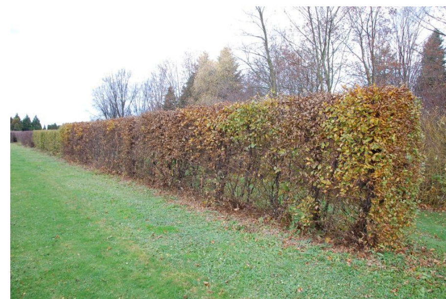
živý plot připomínající spodní patro lesního porostu