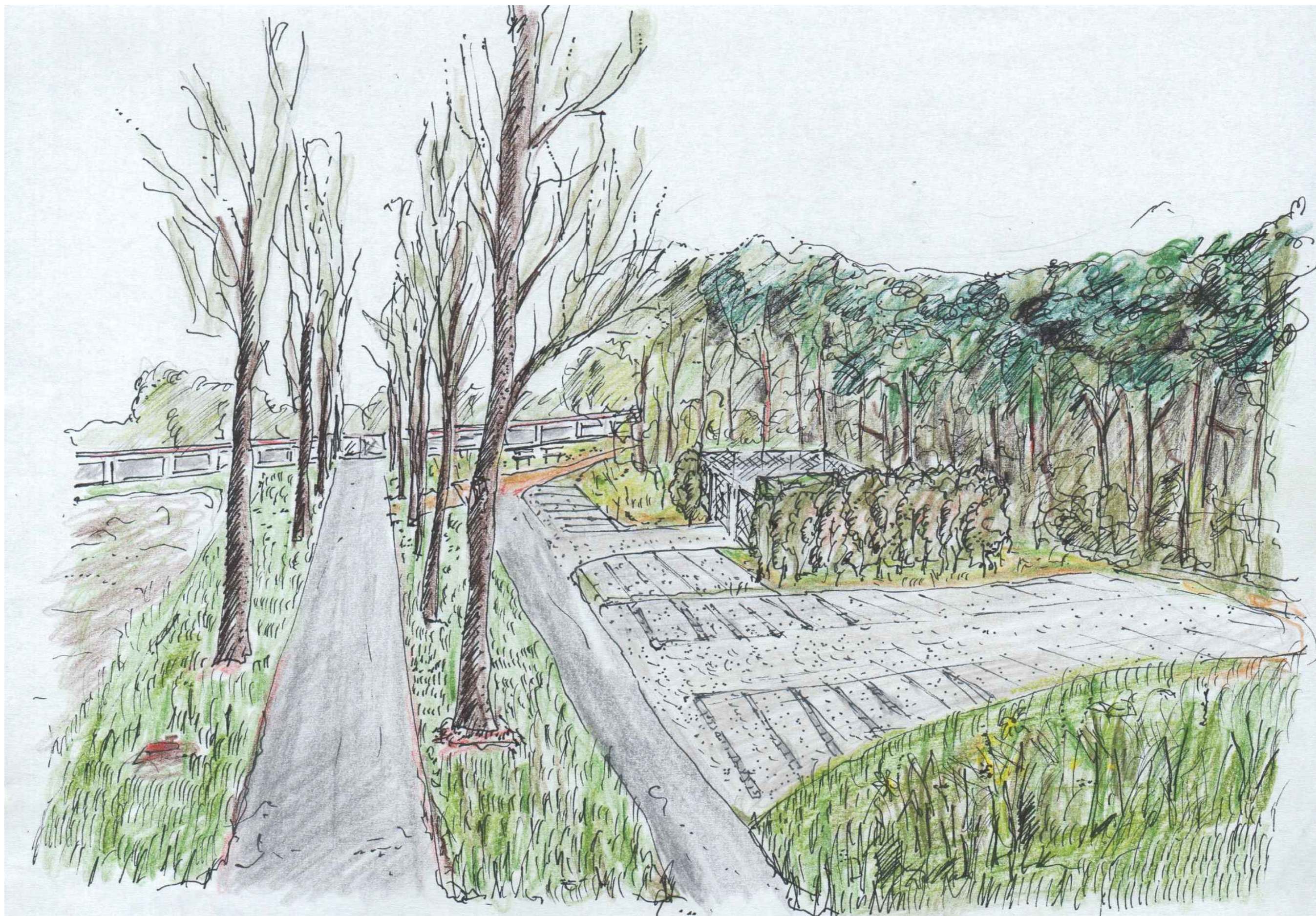
pohled na lokalitu s přírodě blízkým řešením kontejnerového stání