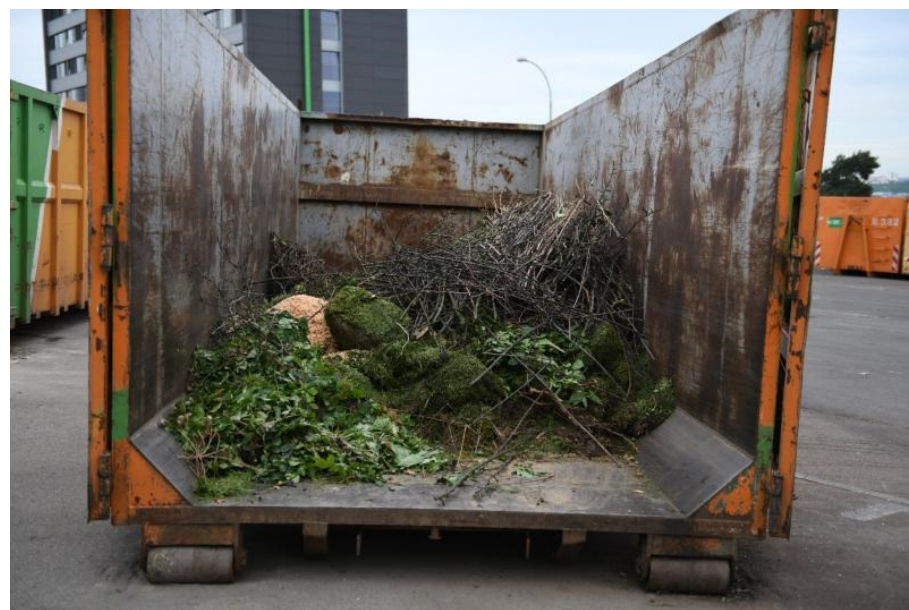
velkoobjemové kontejnery na bioodpad